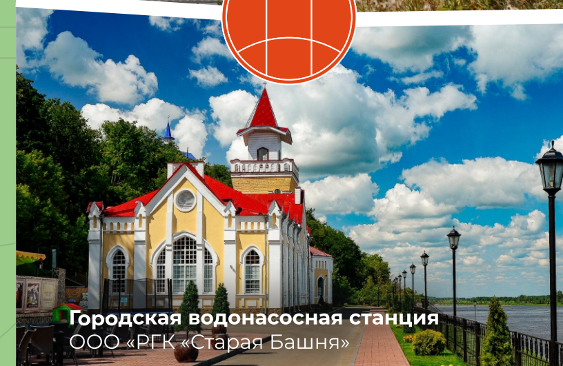
Городская водонасосная станция ООО «РГК «Старая Башня»